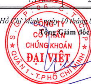
DIỆP TRÍ MINH